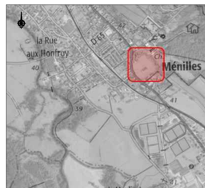
Plan de situation de l'opération / Sans Echelle