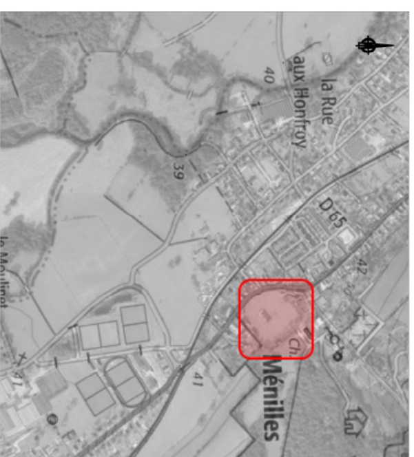
Plan de situation de l'opération / Sans Echelle

PA n° : PA 27397 23 A0001 Délivré le : 18/04/2023