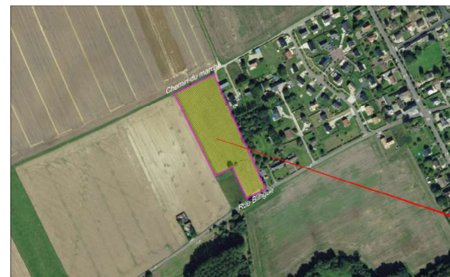
Assiette du permis d'aménager